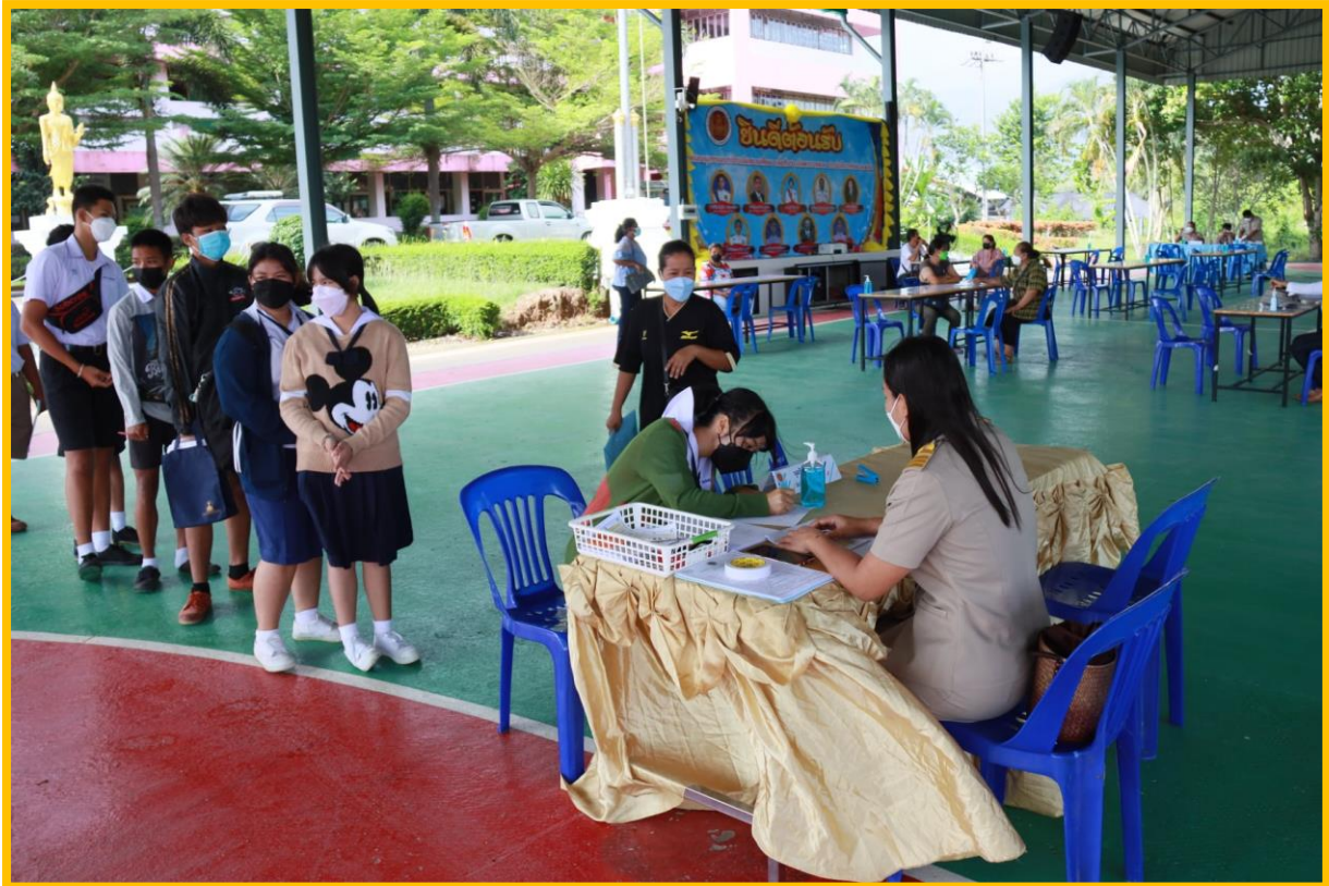
ลงทะเบียนนักเรียน นักศึกษา ปวช.1 และ ปวส.1 ภาคเรียนที่ 1/2565